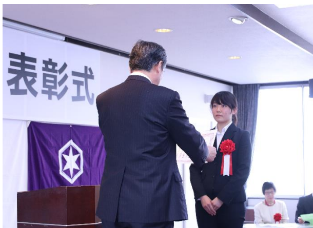
彦根スポーツ賞授賞式の様子

当社は世界に夢と感動を与えるスポーツの発展を目的に、2014年12月1日から公益社団法人日本スカッシュ協会のオフィシャルパートナーを継続してまいりました。これからもダイナムは、世界中に夢と感動を与えるスポーツの発展を応援してまいります。