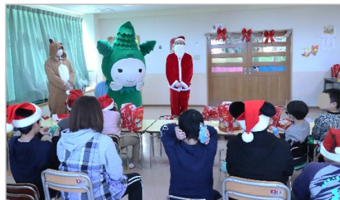
2020年12月（栃木県） 栃木岩舟店 児童福祉施設へ景品寄贈