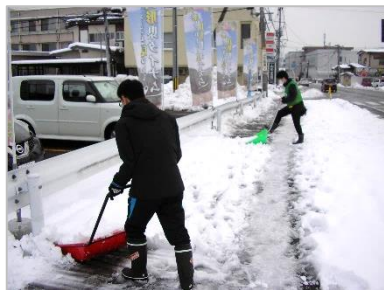
2020年12月（山形県） 山形店 店舗周辺歩道の除雪