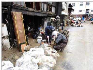
2020年7月（熊本県） 令和2年7月豪雨 被災地ボランティア