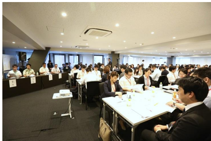
勉強会に参加した従業員の様子