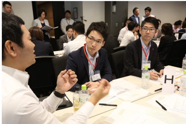
ワークショップにて議論する様子