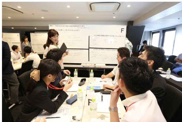
事例を基に、気付きやお客様への声掛けを話し合う様子