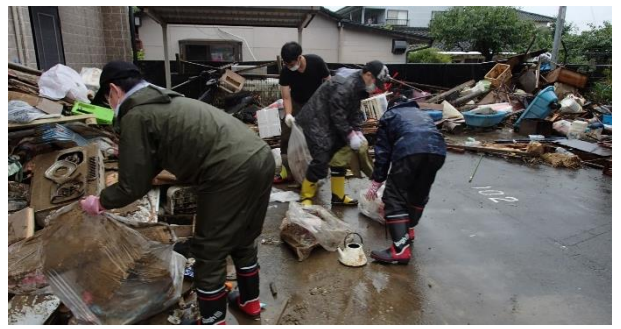
家屋の片付けと清掃