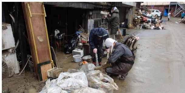
堆積土砂のかき出し

7月8日（水）～7月10日（金）に、令和2年7月豪雨による被害が大きかった熊本県人吉市のダイナム熊本人吉店周辺地域に社員を派遣し、災害ゴミの搬出、泥出し、家屋の清掃・片付け等のボランティア活動を行いました。今後も被害状況に合わせて、地域の復旧・復興のためのボランティア活動に積極的に取り組んでまいります。