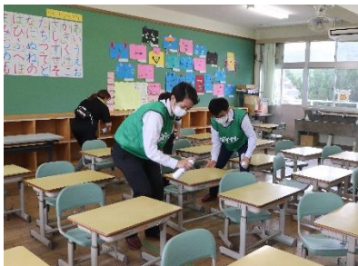
2021年6月（高知県土佐市） 高石小学校 光触媒コーティング実施