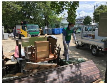
2021年8月（福岡県久留米市） 令和3年8月豪雨 被災地ボランティア