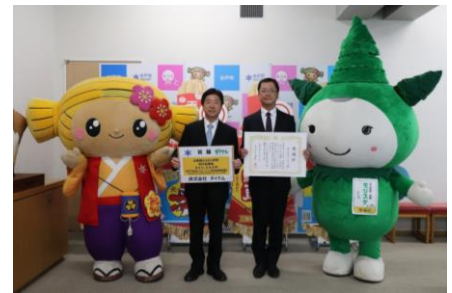
2021年10月（茨城県水戸市） 企業版ふるさと納税 目録贈呈式