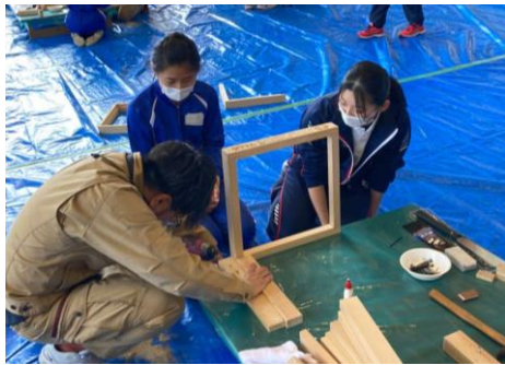
椅子づくりの指導を受ける児童