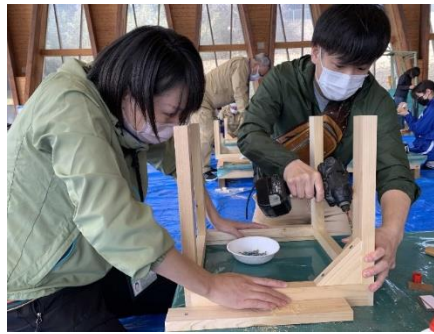
椅子づくりに参加するダイナムの従業員