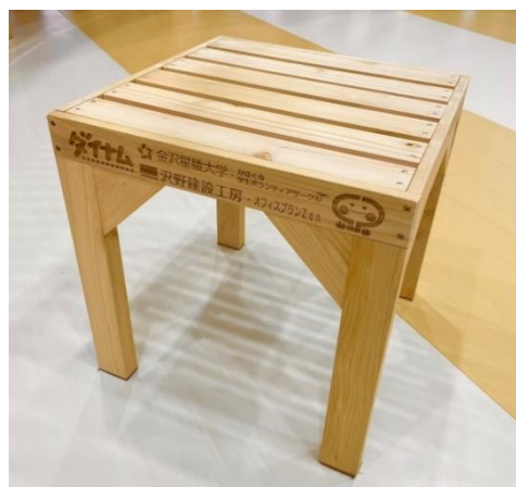
「能登ヒバ」で作られた卒業記念制作の椅子